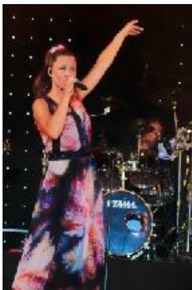
Nathasha St Pier